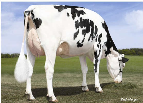
MS C-HAVEN OMAN KOOL