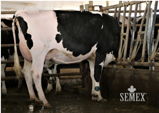
PELLERAT KANE FALBALA